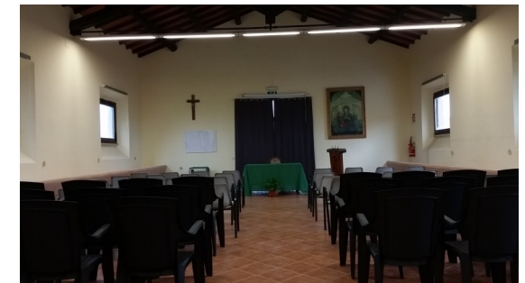
Sala Papa Francesco - Centro di Spiritualità